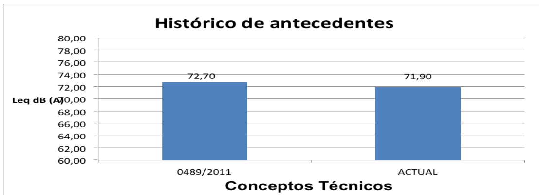
Gráfico No. 1 Histórico de antecedentes